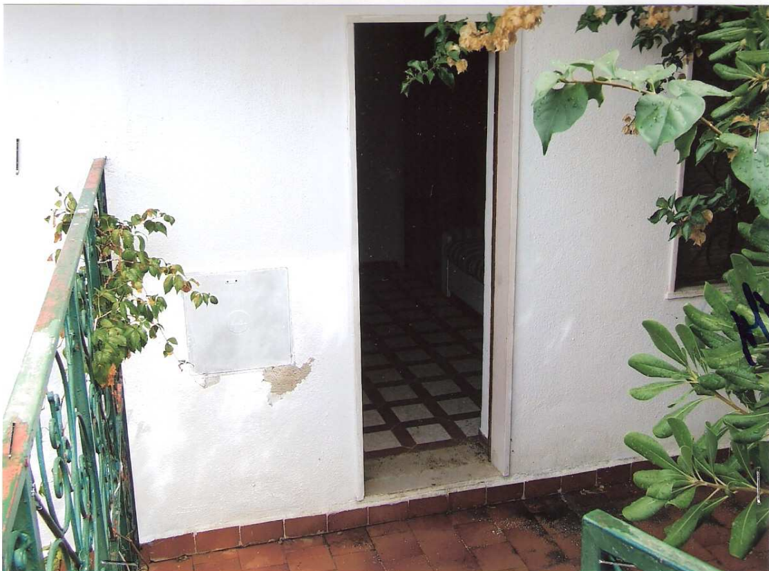
Foto n° 4 - LOTTO n. 8 : Particolare accesso principale dell'immobile pignorato (appartamento a P.T.) dalla corte privata – Peschici, villaggio Valle Scinni (FG).