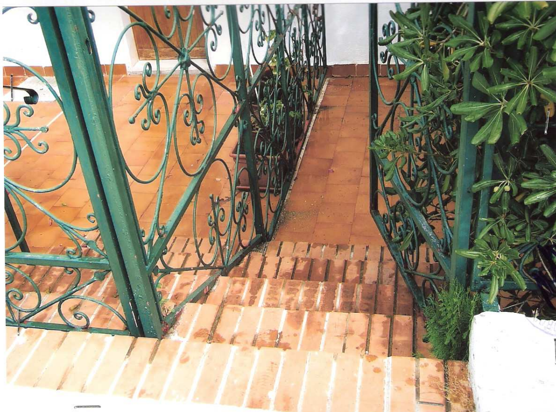
Foto n° 2 - LOTTO n. 8 : Particolare accesso principale all'immobile pignorato (appartamento a P.T.) dalla stradina condominiale – Peschici, villaggio Valle Scinni (FG).