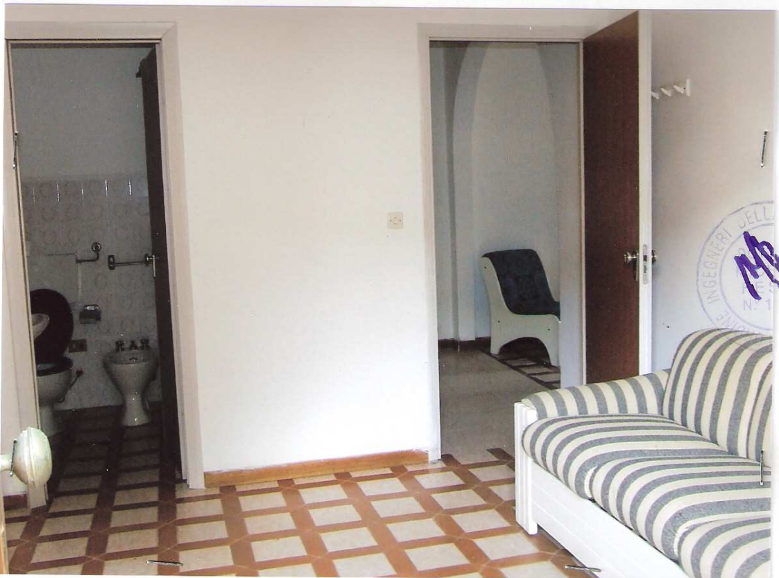
Foto n° 6 - LOTTO n. 8 : Particolare rifiniture interne dell'immobile pignorato (appartamento a P.T.) – Peschici, villaggio Valle Scinni (FG).