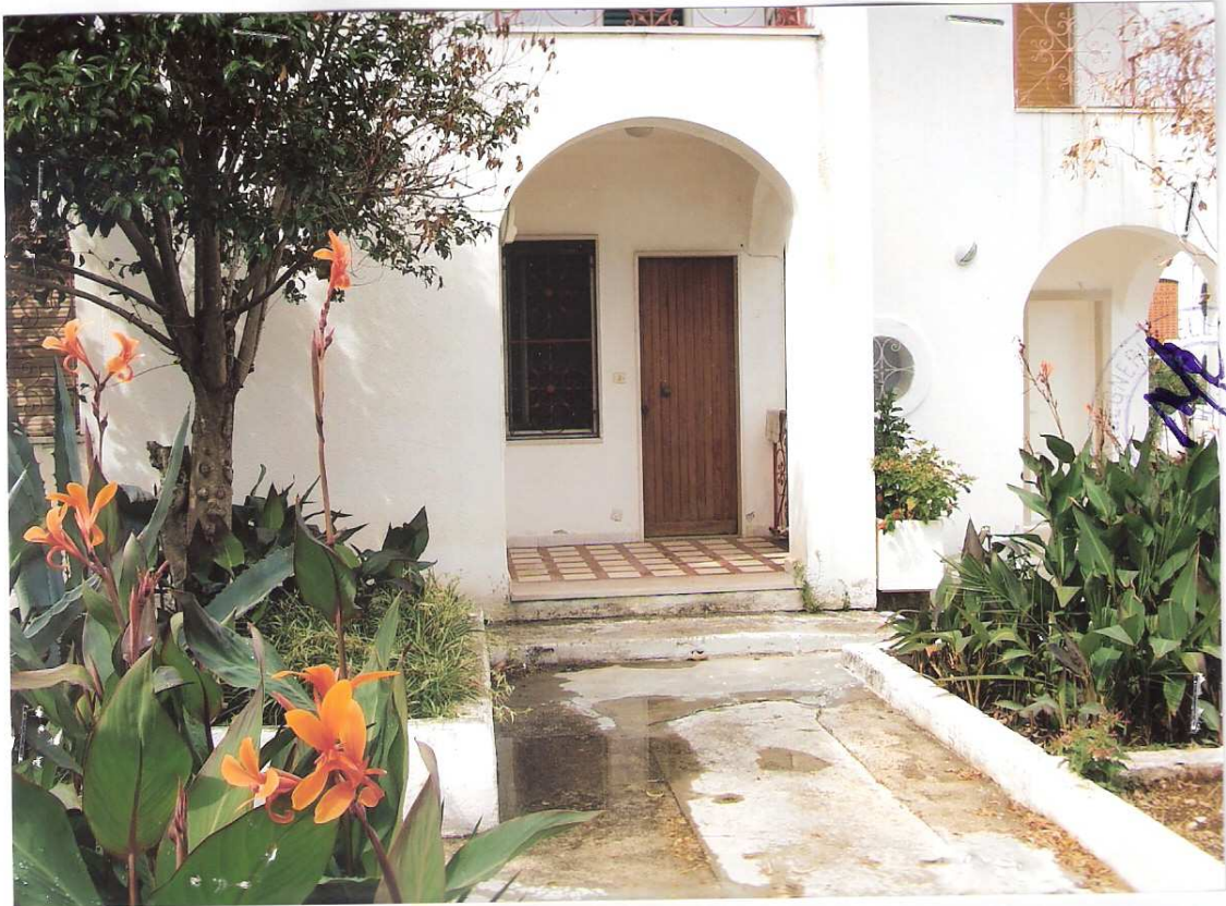
Foto n° 11 - LOTTO n. 8 : Particolare accesso secondario dell'immobile pignorato (appartamento a P.T.) da zona condominiale - Peschici, villaggio Valle Scinni (FG).