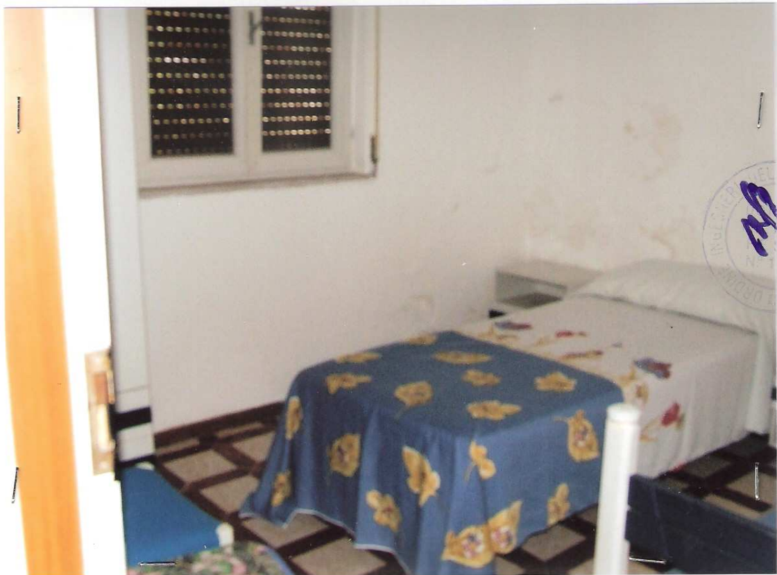
Foto n° 10 - LOTTO n. 8 : Particolare rifiniture interne dell'immobile pignorato (appartamento a P.T.) – Peschici, villaggio Valle Scinni (FG).