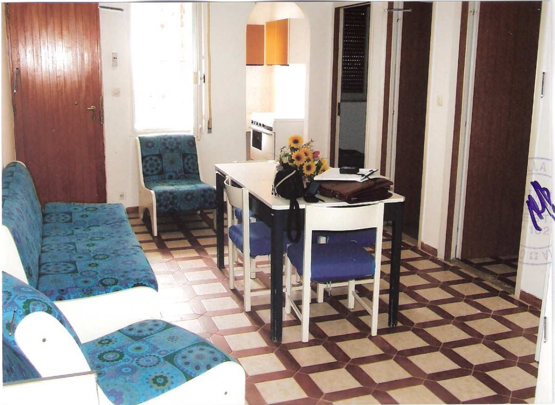
Foto n° 5 - LOTTO n. 8 : Particolare rifiniture interne dell'immobile pignorato (appartamento a P.T.) – Peschici, villaggio Valle Scinni (FG).