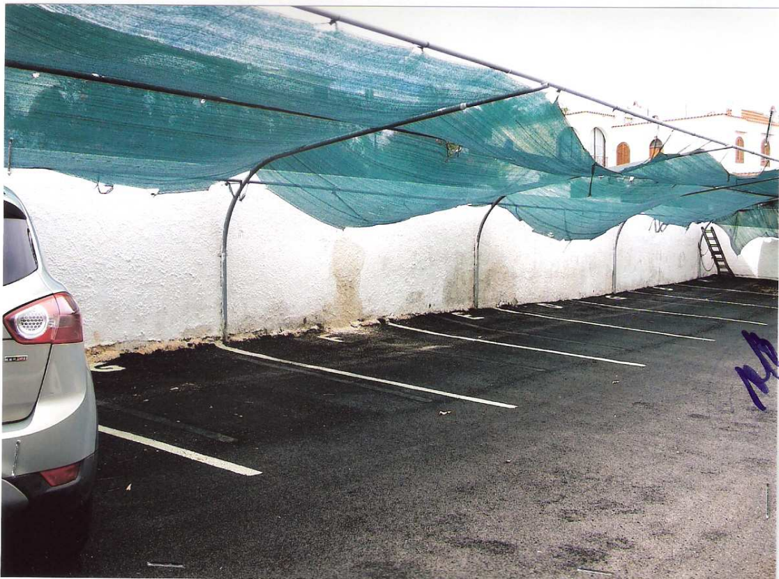
Foto n° 12 - LOTTO n. 8 : Particolare posto macchina esterno antistante l'ingresso principale dell'immobile pignorato (appartamento a P.T.) - Peschici, villaggio Valle Scinni (FG).