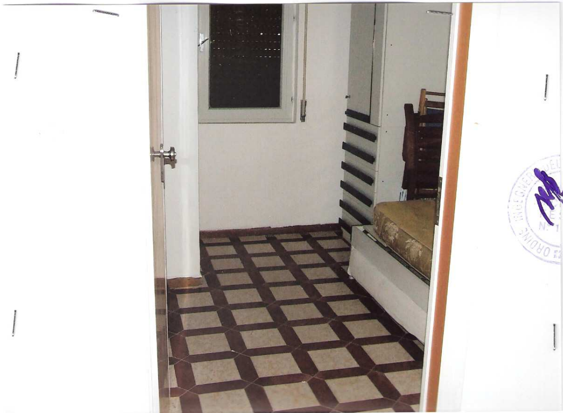
Foto n° 9 - LOTTO n. 8 : Particolare rifiniture interne dell'immobile pignorato (appartamento a P.T.) – Peschici, villaggio Valle Scinni (FG).