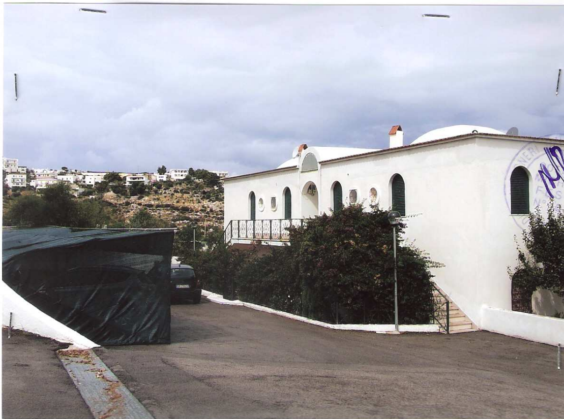
Foto n° 1 - LOTTO n. 8 : Particolare prospetto del fabbricato condominiale di ubicazione dell'immobile pignorato (appartamento a P.T.) dalla stradina condominiale – Peschici, villaggio Valle Scinni (FG).