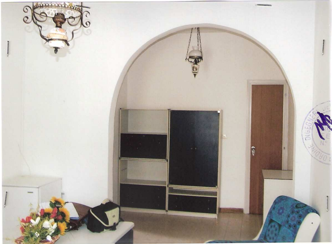
Foto n° 7 - LOTTO n. 8 : Particolare rifiniture interne dell'immobile pignorato (appartamento a P.T.) – Peschici, villaggio Valle Scinni (FG).