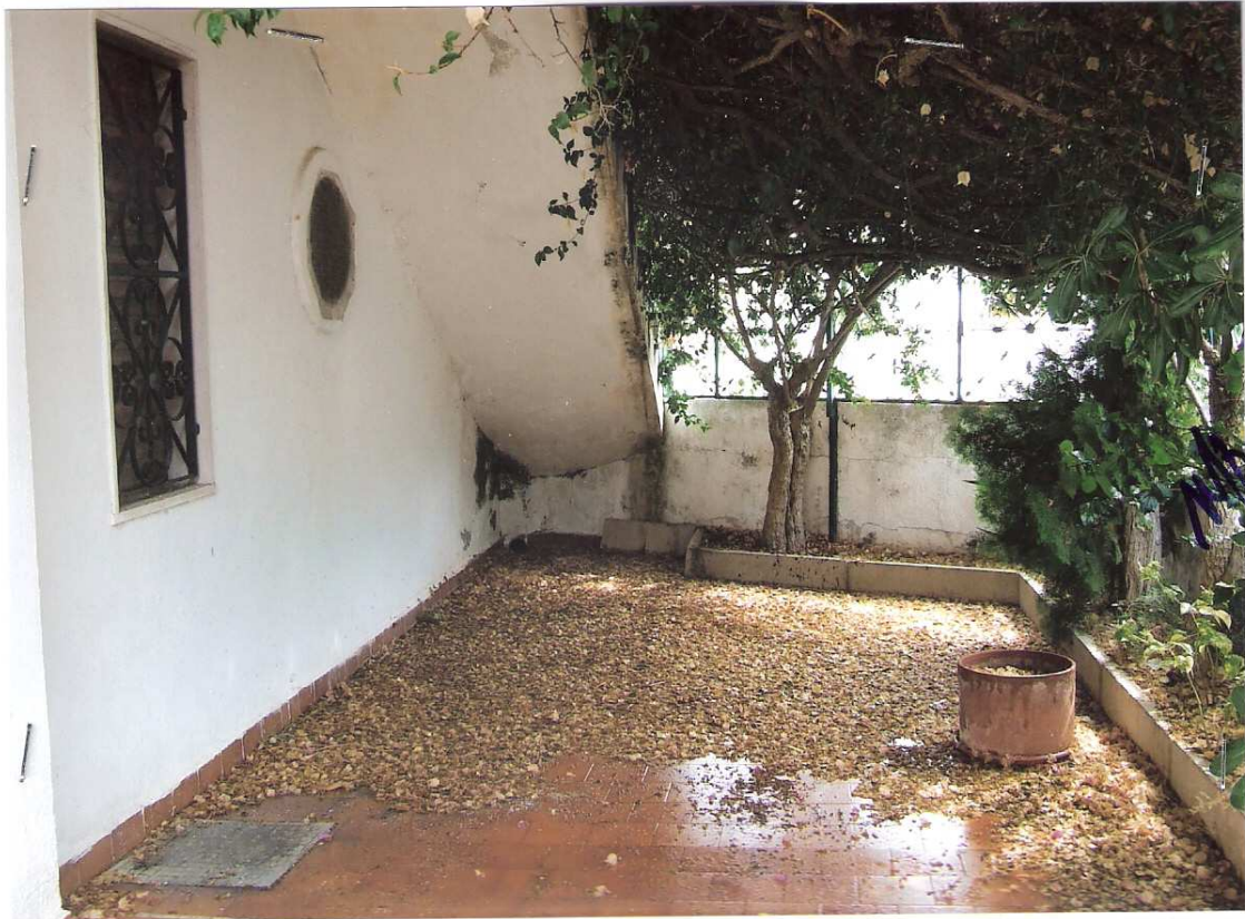
Foto n° 3 - LOTTO n. 8 : Particolare corte privata dell'immobile pignorato (appartamento a P.T.) zona accesso principale a confine con la stradina condominiale – Peschici, villaggio Valle Scinni (FG).